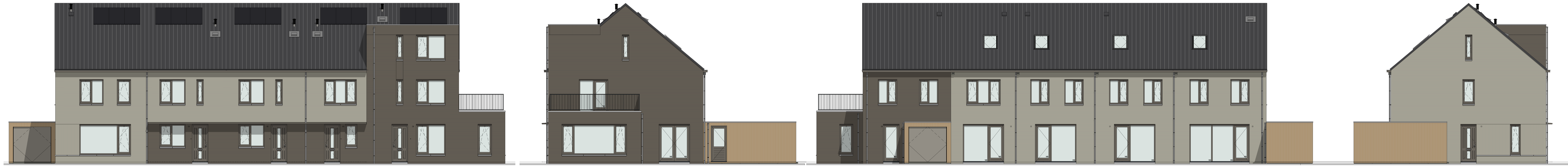
Voorgevel Bouwnummer 15 Bouwnummer 16 Bouwnummer 17 Bouwnummer 18 Bouwnummer 19 Rechter zijgevel Bouwnummer 19 Achtergevel Bouwnummer 19 Bouwnummer 18 Bouwnummer 17 Bouwnummer 16 Bouwnummer 15 Linker zijgevel Bouwnummer 15